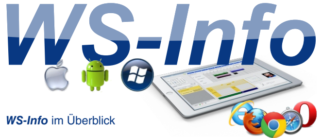
WS-Info im Überblick

Ein weiterer Vorteil ist, dass Sie wertvolle Zeit bei der Einrichtung der Software sparen: Da keine Installation auf den einzelnen Endgeräten erforderlich ist, können Sie einfach die WS-Info Web-Applikation als Cloudlösung im Browser aufrufen, sich anmelden und sofort mit der Arbeit beginnen.